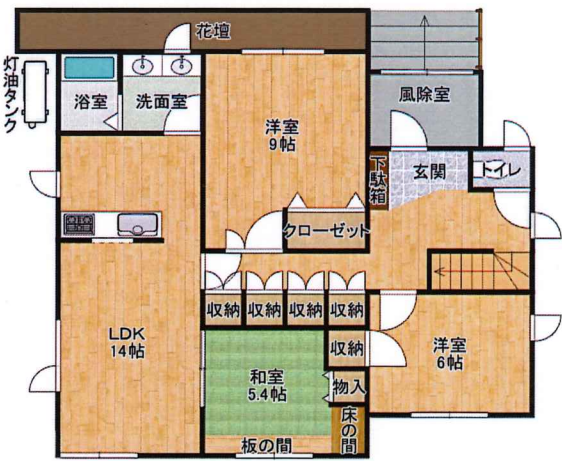
間取図(手書きにつき現況優先)